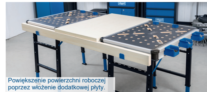
Powiększenie powierzchni roboczej poprzez włożenie dodatkowej płyty.

Zintegrowana podziałka pomiarowa umożliwia szybkie i dokładne docinanie elementów