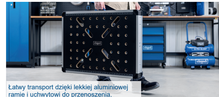
Łatwy transport dzięki lekkiej aluminiowej ramie i uchwytowi do przenoszenia.